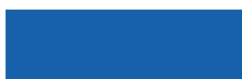
RAL 5015 Sky blue Небесно-синий