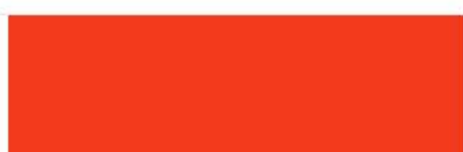
RAL 2004 Pure orange Оранжевый