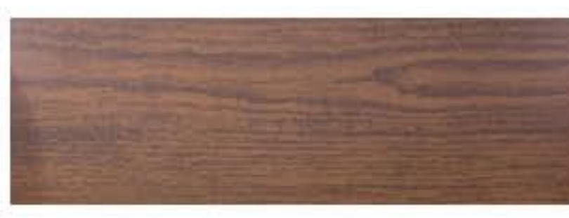
Ecosteel - Морёный дуб матовый