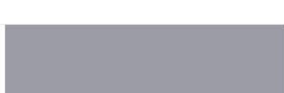
RAL 7004 Signal grey Сигнальный серый