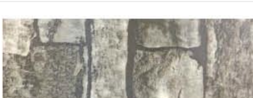
Ecosteel - Белый камень