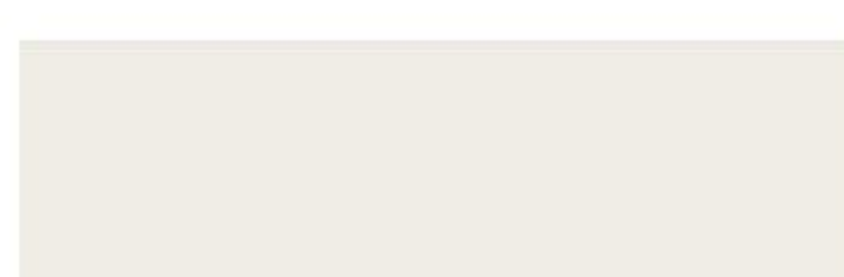
RAL 9002 Grey white Светло-серый