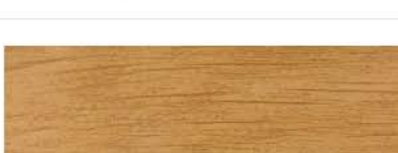
Ecosteel - Лиственница