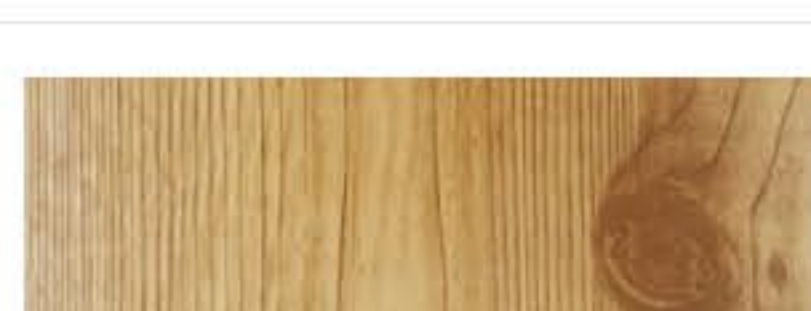
Ecosteel - Сосна текстурированная