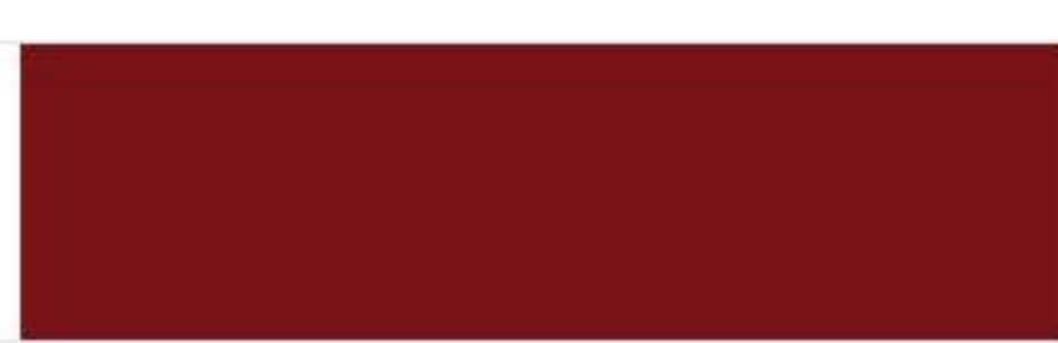
RAL 3011 Brown red Коричнево-красный