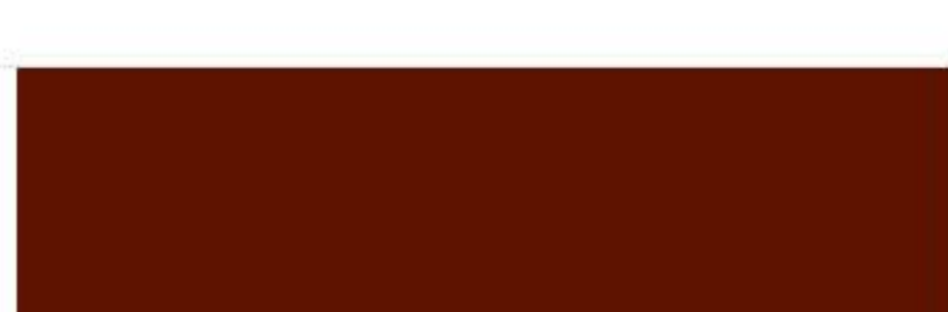
RR 29 Red Красный