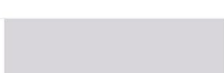
RAL 7047 Telegrau 4 Телегрей 4