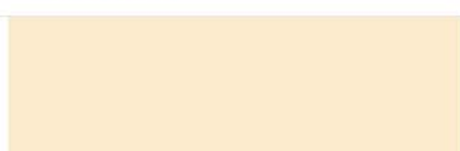
RAL 1015 Light ivory Светлая слоновая кость