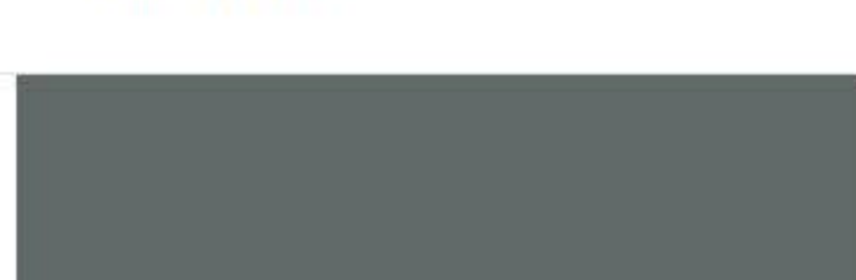
RAL 7005 Mouse grey Мышино-серый