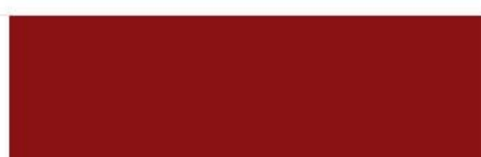
RAL 3003 Ruby red Рубиновый