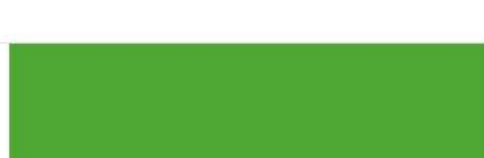
RAL 6018 May green Желто-зелёный