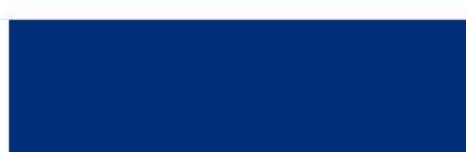
RAL 5005 Signal blue Сигнальный синий