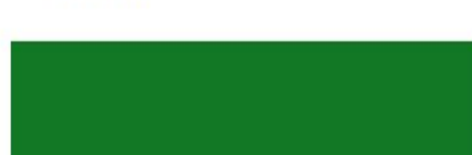
RAL 6029 Mint green Мятно-зелёный