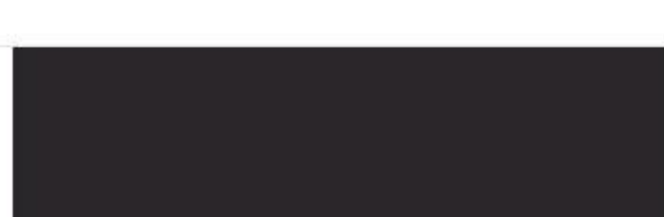
RR 32 Dark Brown Тёмно-коричневый