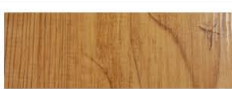
Ecosteel - Кедр