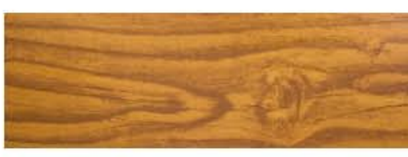
Ecosteel - Золотой дуб текстурированный Двусторонний

Карта цветов металлочерепицы, профнастила, сайдинга, линейных панелей, плоского листа и отделочных элементов Металл Профиль, ТСП Airpanel Экран Вашего компьютера может давать цветовое искажение, поэтому возможно отличие от действительных цветов.