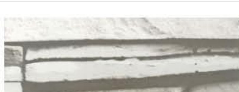
Ecosteel - Белый плитняк