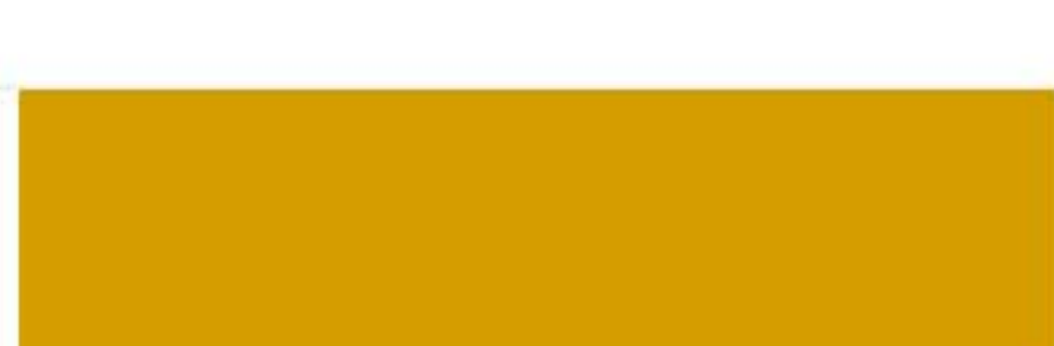
RAL 7035 Light grey Светло-серый