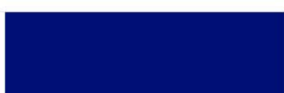
RAL 5002 Ultramarine blue Ультрамариново-синий