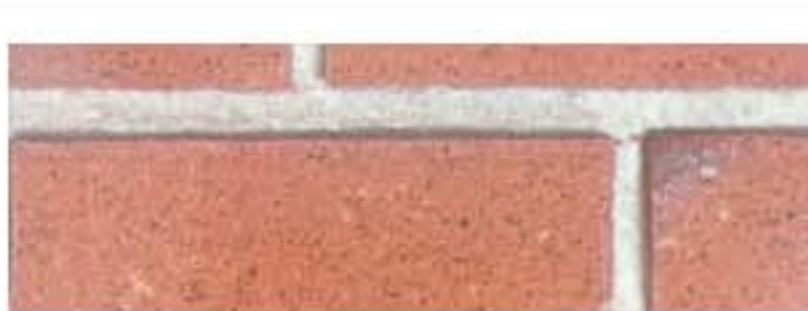
Ecosteel - Кирпич