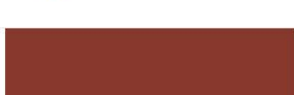
RR 760 Copper brown Кирпичный