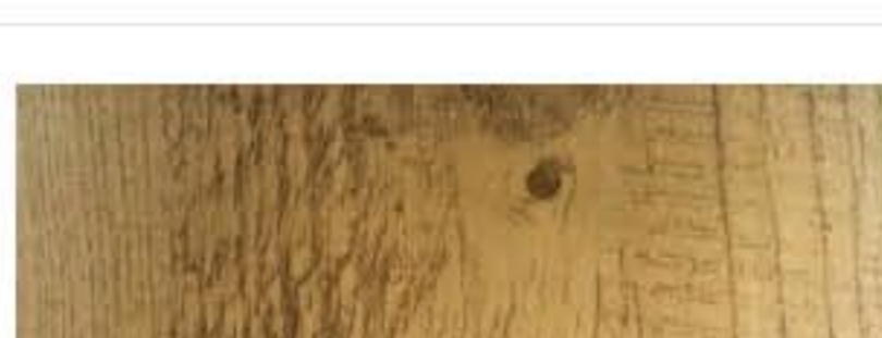
Ecosteel - Сосна матовая