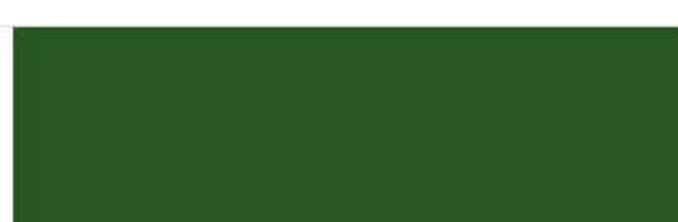
RAL 6002 Leaf green Лиственно-зелёный