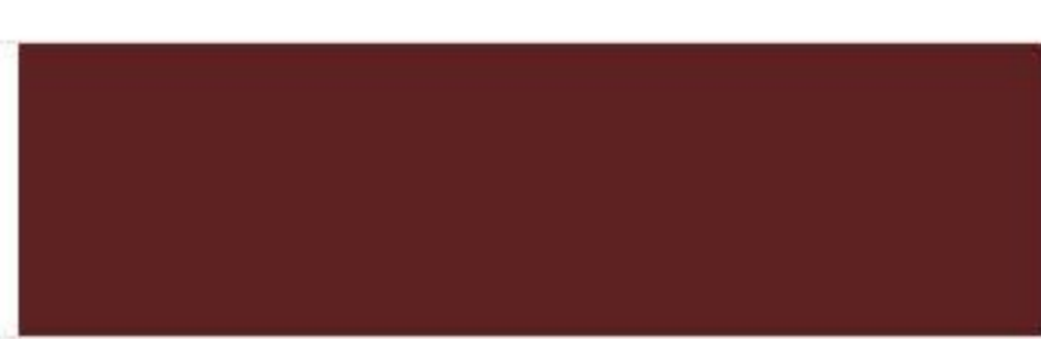
RAL 3009 Oxide red Оксид красный