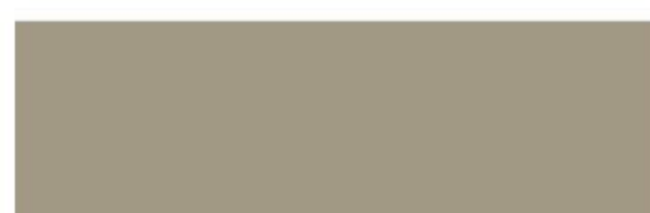
RAL 1035 Pearl Beige Перламутровый бежевый