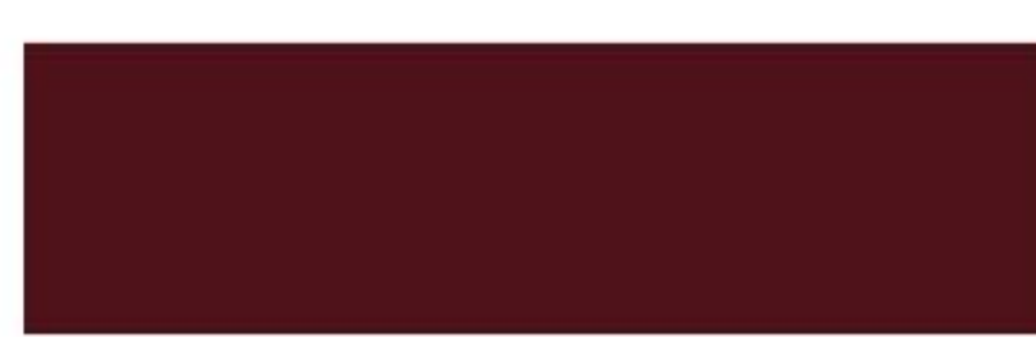
RAL 3005 Wine red Винно-красный