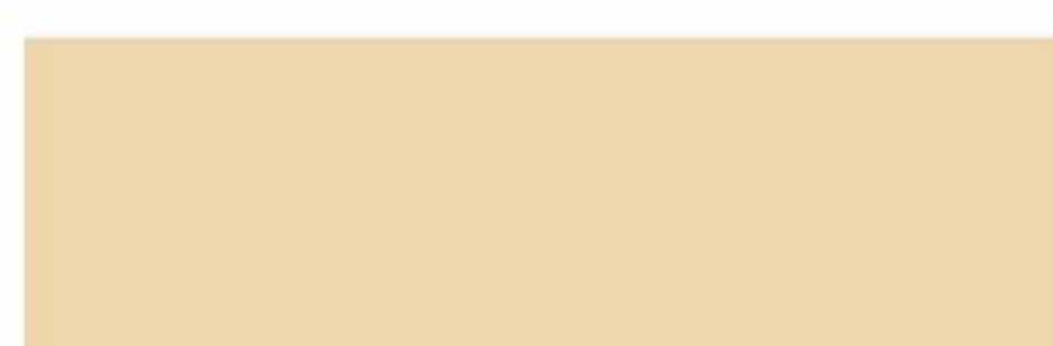
RAL 1014 Ivory Слоновая кость