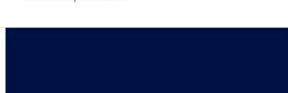
RR 779 Violet Фиолетовый