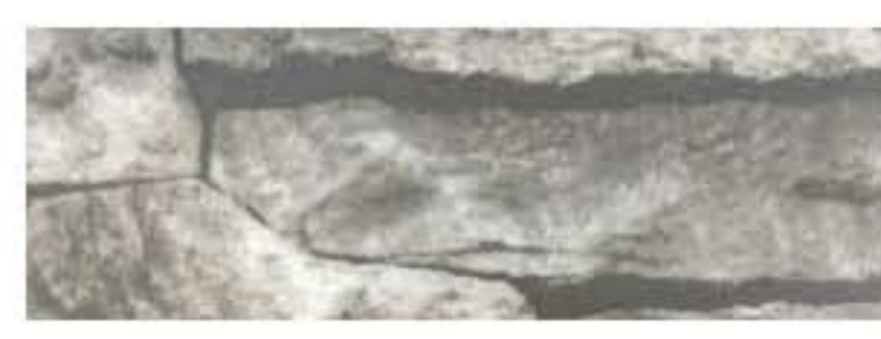
Ecosteel - Белый камень продольный Двусторонний