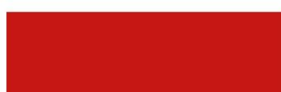
RAL 3020 Traffic red Транспортный красный