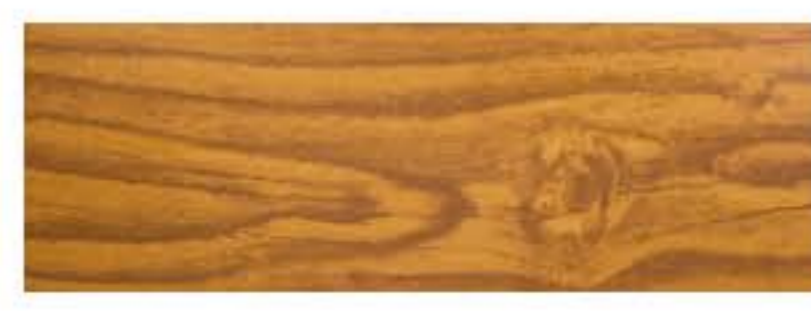
Ecosteel - Золотой дуб