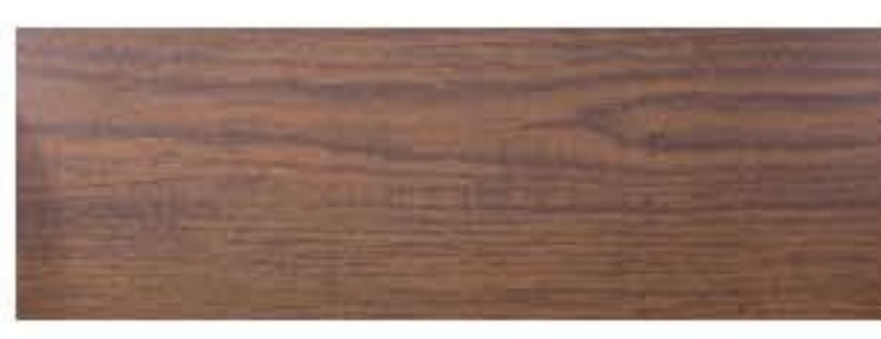
Ecosteel - Морёный дуб матовый Двусторонний