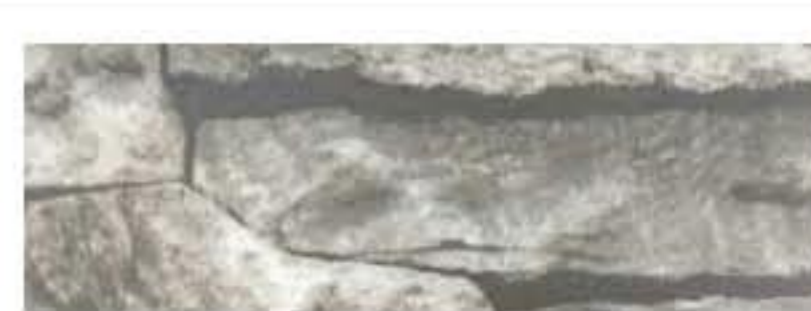
Ecosteel - Белый камень ПР