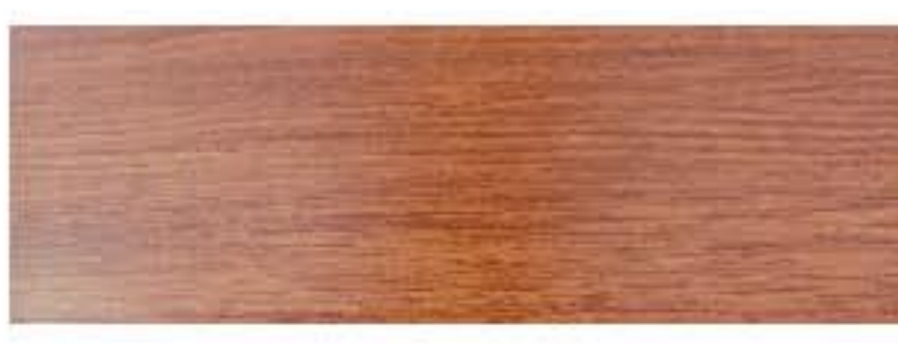
Ecosteel - Морёный дуб глянцевый