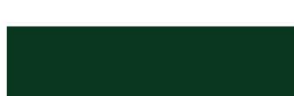
RAL 6005 Moss green Зелёный мох