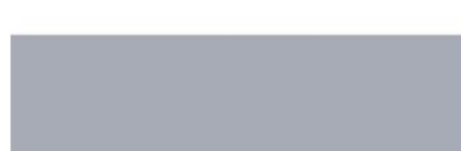
RAL 9006 White aluminium Бело-алюминиевый